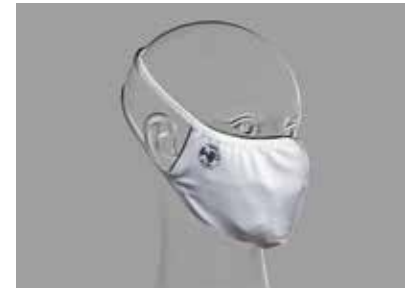
vue de côté